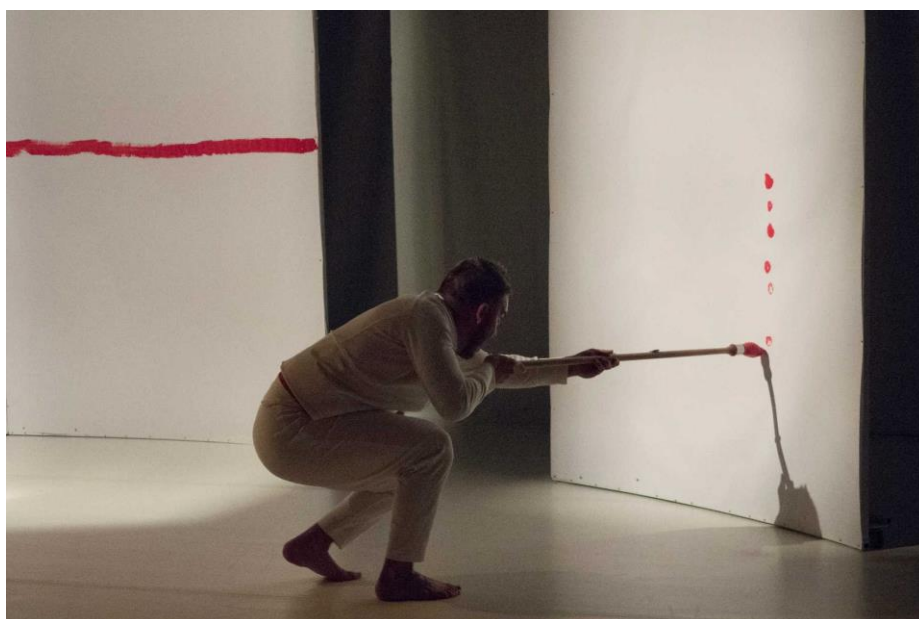
« en UN éclat » - © Dominique Vérité

La première tente, aidée du second, de retrouver en UN éclat cette posture colimaçonne. Le second cherche à la quitter.