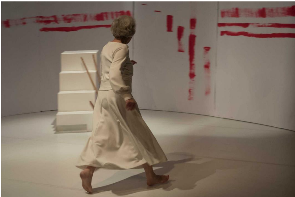
« en UN éclat » - © Dominique Vérité

Il s'agit donc, aussi, de se poser la question du temps, celui que l'on a, celui que l'on prend, celui après lequel on court, celui que l'on a plus.