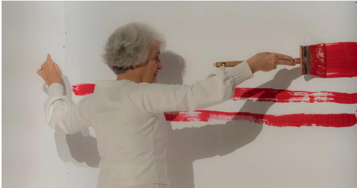
« en UN éclat »

La première laisse affleurer, revenir les gestes de l'enfance. Le second, doucement, laisse s'éloigner ces gestes pour grandir.