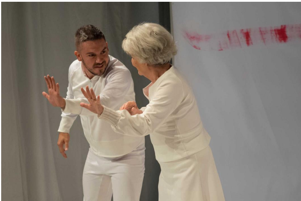
« en UN éclat » - © Dominique Vérité

en UN éclat une pièce qui s'articule autour de nos peaux d'enfances et de la transmission.