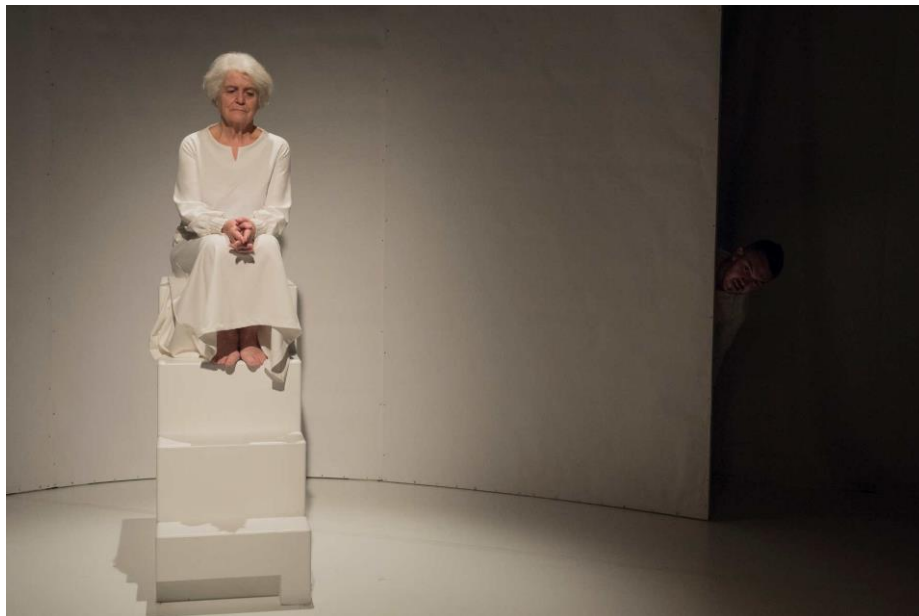
« en UN éclat »

=> co-écriture Marc-Antoine Cyr, Laurance Henry