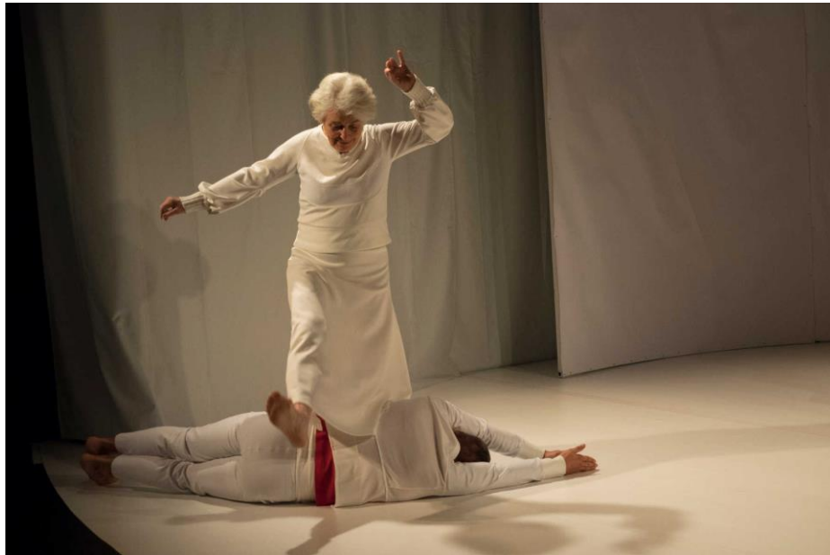
« en UN éclat » - © Dominique Vérité

"J'ai éprouvé régulièrement du fond de mon être ce besoin de retrouver cette posture colimaçonne . Je me suis courbée pour écrire. Pour écrire de l'enfant que j'ai senti en un éclat et que je sens de loin, de très loin approcher en moi comme une mémoire perdue dans les dédales d'un corps d'enfant. Me ressentirais-je dans le cœur de l'enfant autant en moi pour ressentir autant de moi ?"