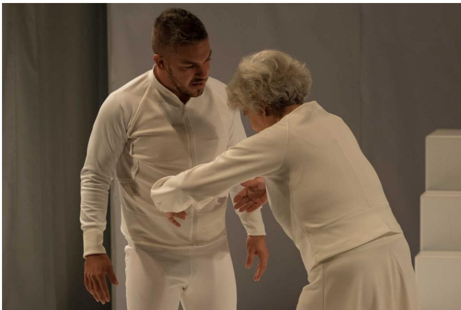
« en UN éclat » - © Dominique Vérité

Dans l'espace, les deux corps se confrontent, se jaugent, jouent de l'énergie de l'un, de la précision de l'autre.